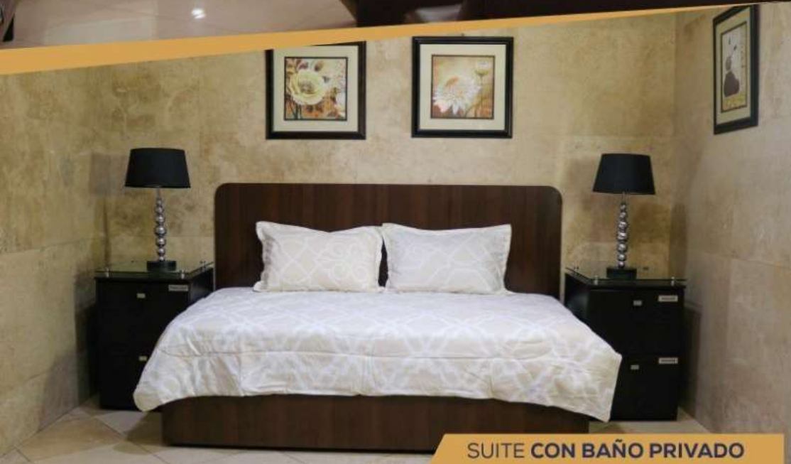
SUITE CON BAÑO PRIVADO